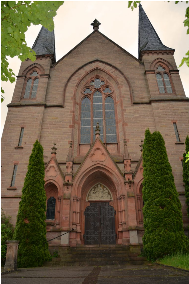
Blick auf die Westseite mit beidseitigen Türmen und dem Portal (Sonja Kasprick, 2019)