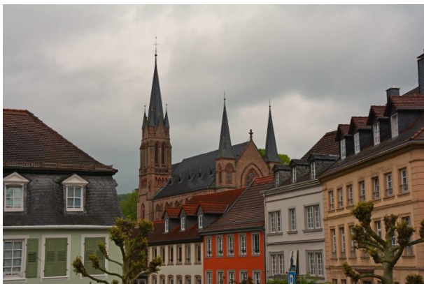
Blick von der evangelischen Stadtkirche zur katholischen Kirche St. Ägidius in Kusel (Sonja Kasprick, 2019)

Raphaela Maertens am 20.03.2019 um 10:13:20Uhr