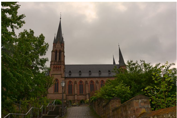
Blick auf die Nordseite der katholischen Pfarrkirche St. Ägidius in Kusel (Sonja Kasprick, 2019)