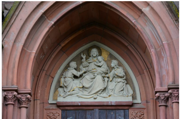
Christus-Darstellung im Giebel des Westportals (Sonja Kasprick, 2019)