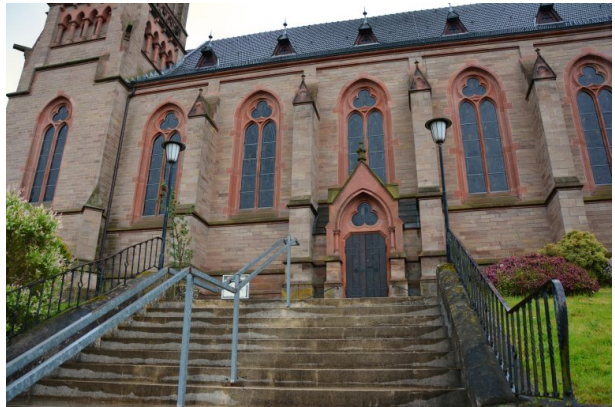
(Sonja Kasprick, 2019)