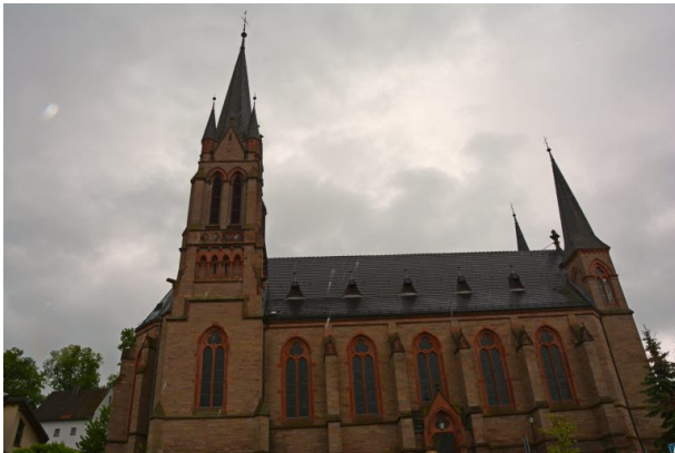
Blick auf die Nordseite der katholischen Pfarrkirche St. Ägidius in Kusel (Sonja Kasprick, 2019)