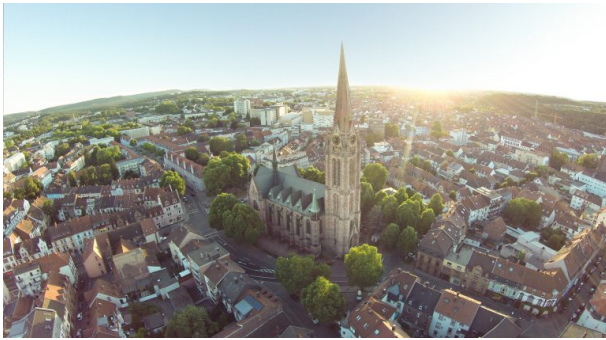
Marienkirche in Kaiserslautern (Anna Wojtas, 2015)