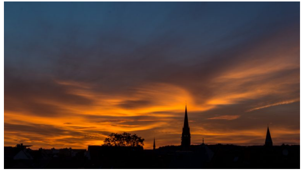
Marienkirche beim Sonnenuntergang (Axel Gaul, 2015)