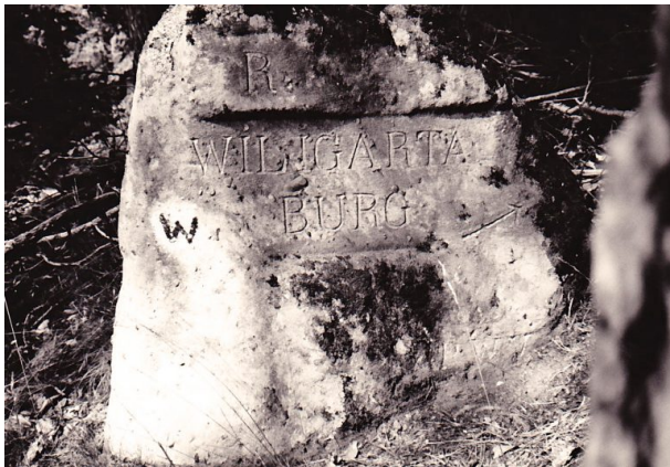
Ritterstein Nr. 49 bei Wilgartswiesen mit der Inschrift "R. Wilgartaburg" und "PWV." sowie mit einem Richtungspfeil versehen. (Erhard Rohe, 1993)

Sonja Kasprick am 27.11.2018 um 10:27:34Uhr