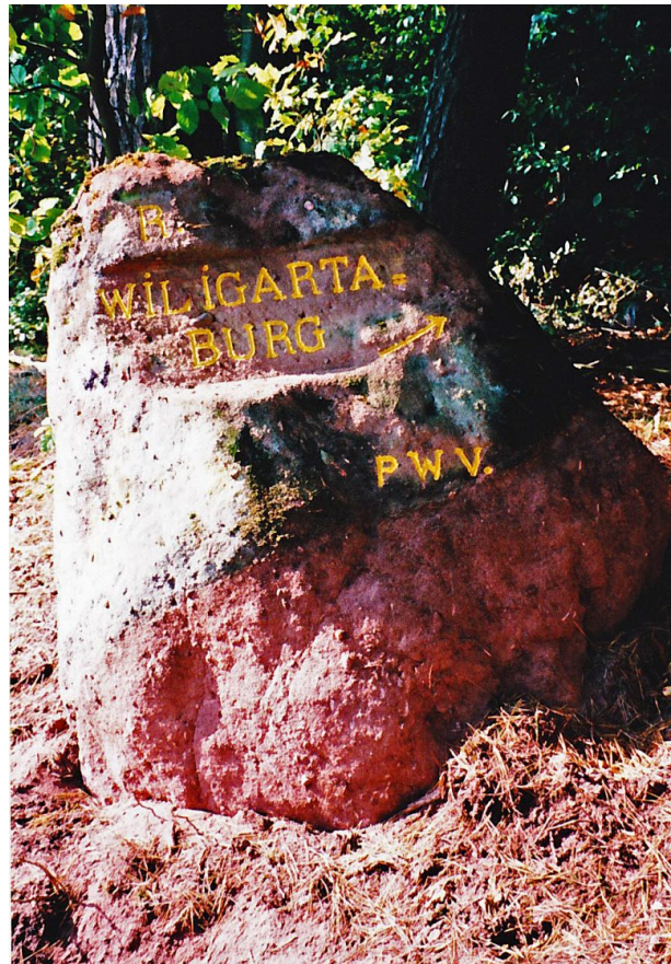
Ritterstein Nr. 49 bei Wilgartswiesen mit der Inschrift "R. Wilgartaburg" und "PWV." sowie mit einem Richtungspfeil versehen.