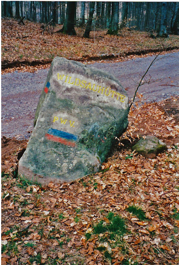
Ritterstein Nr. 50 am Hanseck bei Wilgartswiesen mit der Inschrift "Wildsauhütte" und "PWV." (Erhard Rohe, 2000)