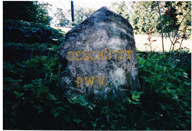
Ritterstein Nr. 53 in Hermersbergerhof mit der Inchrift "Geschützt" und "PWV." (Erhard Rohe, 1996)