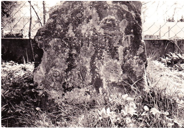
Ritterstein Nr. 53 in Hermersbergerhof mit der Inchrift "Geschützt" und "PWV." (Erhard Rohe, 1993)