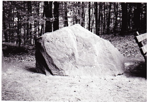
Der Ritterstein „Spalt“. (Erhard Rohe, 1993)