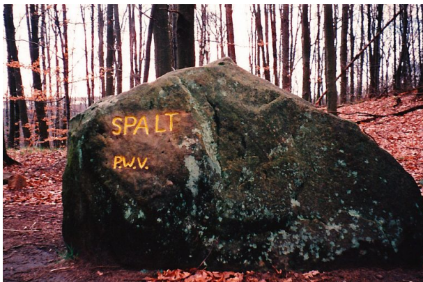
Ritterstein „Spalt“ nach der Renovierung im Jahr 1999. (Erhard Rohe , 2000)