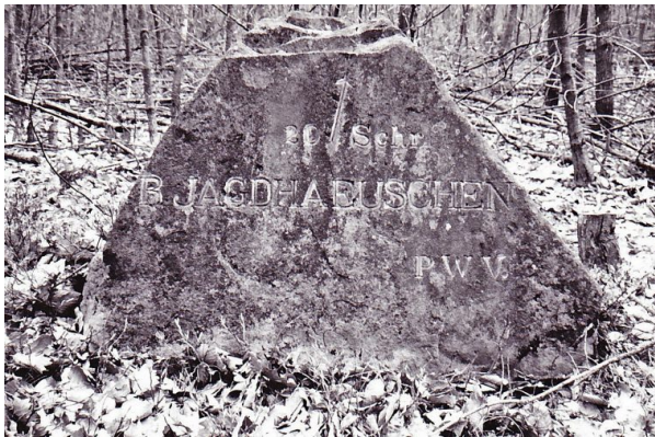
Der Ritterstein „R. Jagdhaeuschen 20 Schr.“ im April 1993. (Erhard Rohe, 1993)