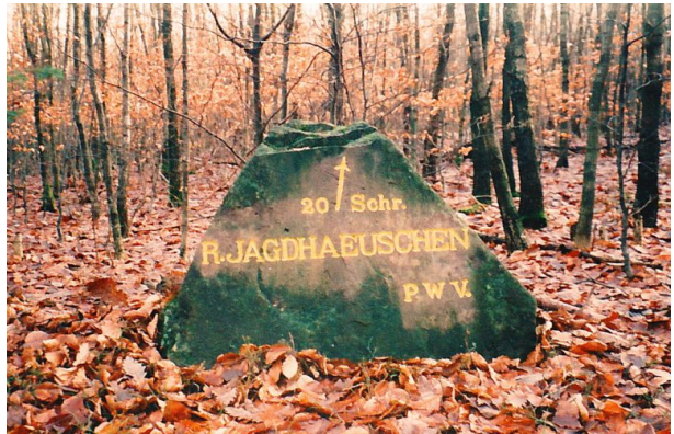
Der Ritterstein „R. Jagdhaeuschen 20 Schr.“ nach der Renovierung im Herbst 1998.