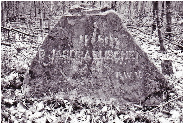
Der Ritterstein „R. Jagdhaeuschen 20 Schr.“ im April 1993.