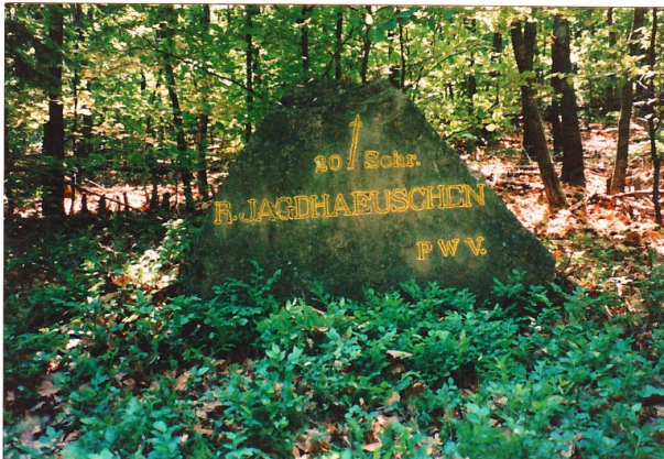
Der Ritterstein „R. Jagdhaeuschen 20 Schr.“ nach der Schriftnachbesserung im Juni 1996. (Erhard Rohe , 1996)