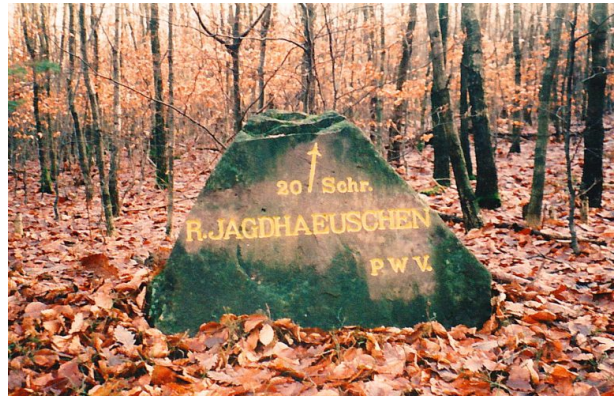
Der Ritterstein „R. Jagdhaeuschen 20 Schr.“ nach der Renovierung im Herbst 1998. (Erhard Rohe , 1998)