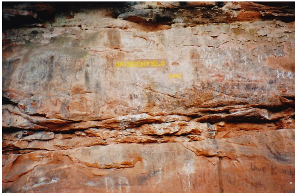
Das Bild zeigt den Ritterstein Nr. 154 im Leinbachtal mit der Inschrift "Griesenfels" und "PWV." (Pfälzerwald-Verein). (Erhard Rohe, 1993)