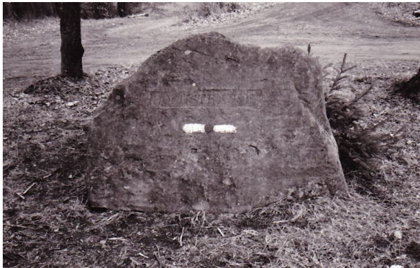
Ritterstein Nr. 160 bei Frankenstein mit der Inschrift "Hochstrasse" und "PWV" (Pfälzerwald-Verein). (Erhard Rohe, 1993)