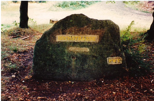
Ritterstein Nr. 160 bei Frankenstein mit der Inschrift "Hochstrasse" und "PWV" (Pfälzerwald-Verein). (Erhard Rohe, 1995)