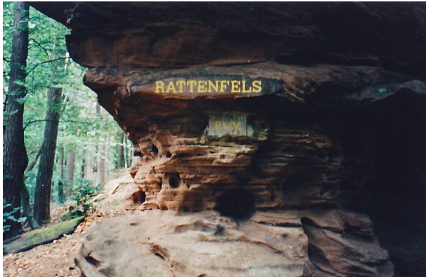
Ritterstein Nr. 164 bei Diemerstein mit der Inschrift "Rattenfels" und "P. W. V." (Pfälzerwald-Verein). (Erhard Rohe, 1994)

Sonja Kasprick am 19.12.2018 um 13:57:11Uhr