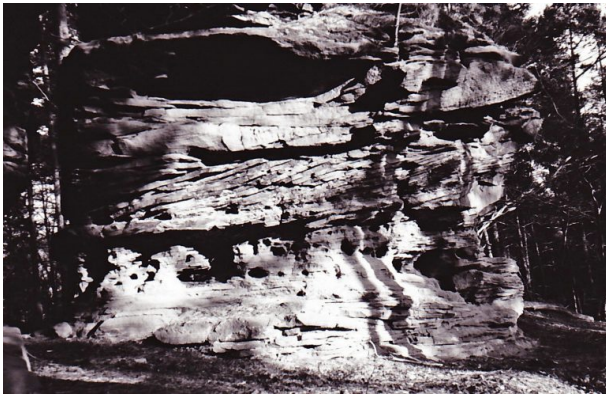
Ritterstein Nr. 164 "Rattenfels" bei Diemerstein. (Erhard Rohe, 1993)