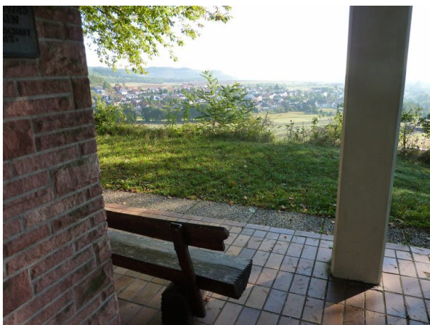
Blick von der Erlöserkapelle (Jürgen Wachowski, 2012)