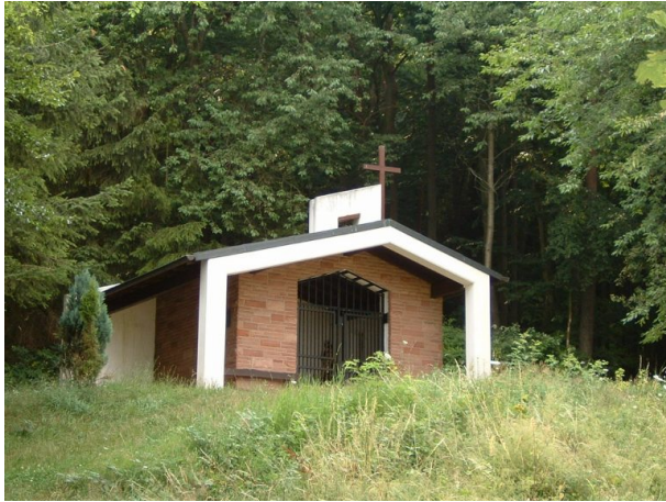
Erlöserkapelle in Ramsen (Jürgen Wachowski, 2005)