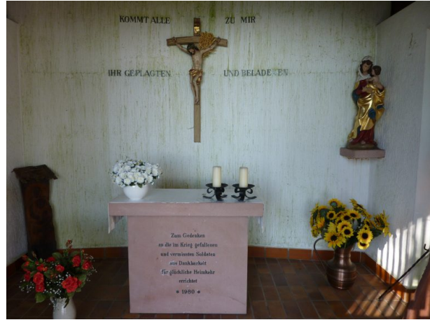
Altar im Innenraum der Erlöserkapelle in Ramsen (Jürgen Wachowski, 2012)