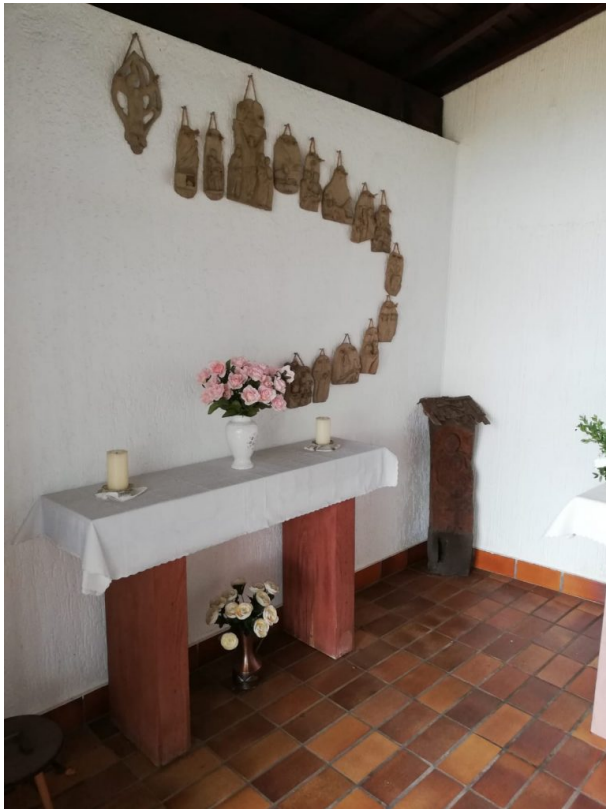
Seitenaltar n der linken Innenwand der Erlöserkapelle (Sonja Kasprick, 2019)