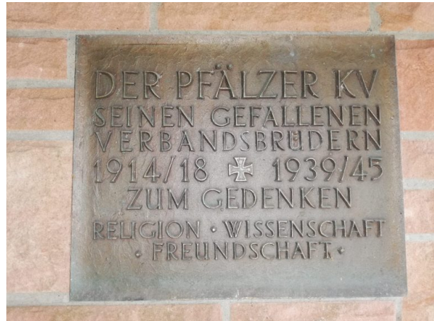
Gedenktafel an die Kriegsgefallenen von Ramsen an der Außenwand der Erlöserkapelle (Sonja Kasprick, 2019)