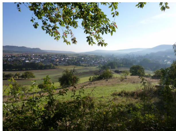
Blick von der Erlöserkapelle (Jürgen Wachowski, 2012)