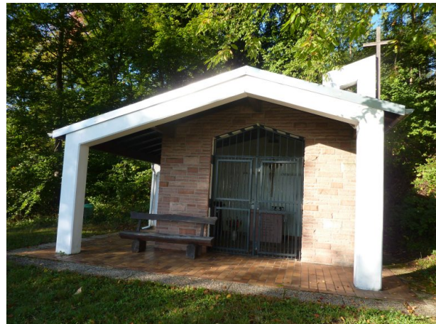
Erlöserkapelle in Ramsen (Jürgen Wachowski, 2012)