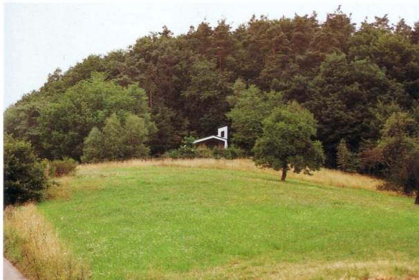
Blick in Richtung Erlöserkapelle in Ramsen (Jürgen Wachowski, 2002)