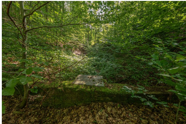
Diebskeller bei Ramsen (Harald Kröher, 2021)