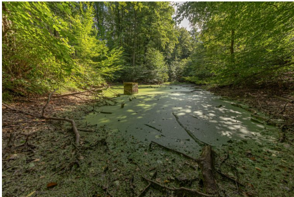
Diebskeller bei Ramsen (Harald Kröher, 2021)