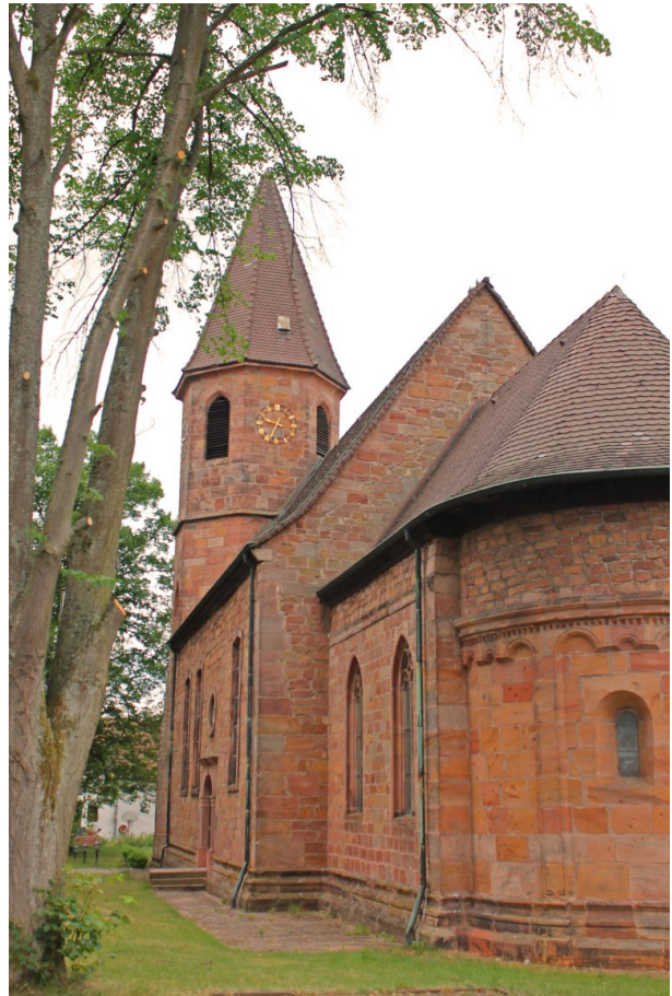
Südostansicht der Simultankirche in Vogelbach vom Chor in Richtung Kirchturm