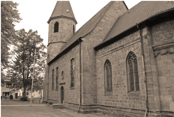
Südostansicht der Simultankirche in Vogelbach vom Chor in Richtung Kirchturm (TU Kaiserslautern, 2017)