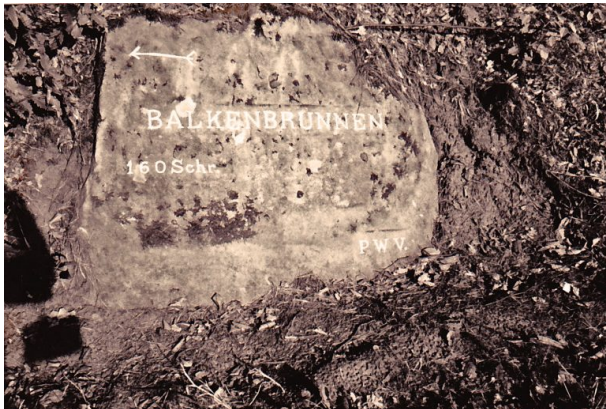
Ritterstein Nr. 134 bei Mölschbach mit der Inschrift "Balkenbrunnen 160 Schr." sowie mit Richtungspfeil nach Westen (Erhard Rohe, 1993)