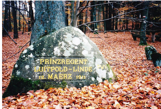
Ritterstein mit der Inschrift „Prinzregent Luitpold-Linde 12. Maerz 1911“ bei Waldleinigen (Erhard Rohe, 1997)