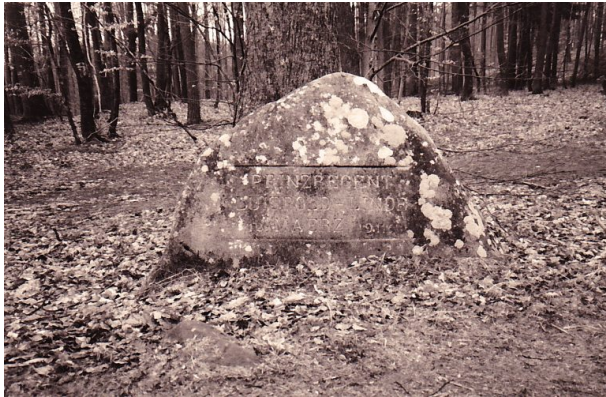
Ritterstein mit der Inschrift „Prinzregent Luitpold-Linde 12. Maerz 1911“ bei Waldleinigen (Erhard Rohe, 1993)

Sonja Kasprick am 14.03.2019 um 10:36:23Uhr