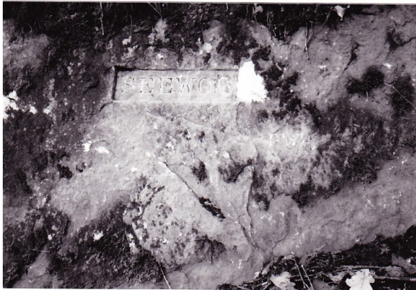
Ritterstein mit der Inschrift "Seewoog" bei Waldleiningen (Erhard Rohe, 1993)