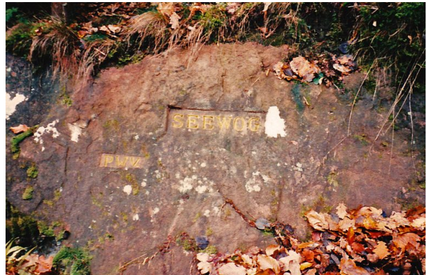
Ritterstein mit der Inschrift "Seewoog" bei Waldleiningen (Erhard Rohe, 1999)