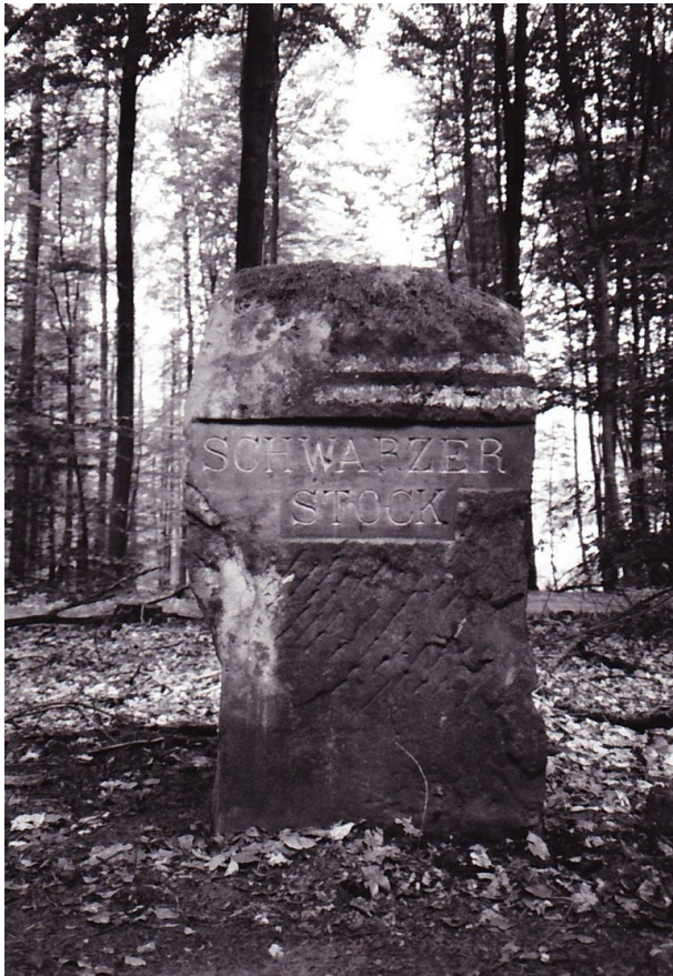
Ritterstein mit der Inschrift "Schwarzer Stock" bei Waldleiningen (Erhard Rohe, 1993)