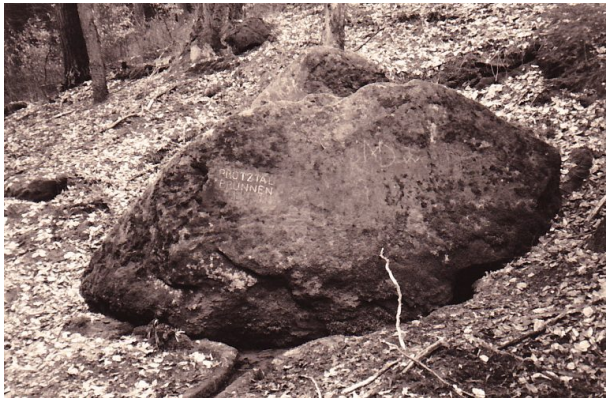
Ritterstein mit der INschrift "Protztalbrunnen" bei Waldleiningen (Erhard Rohe, 1993)