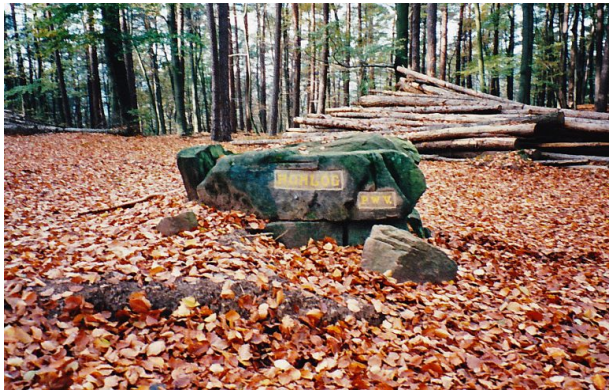
Ritterstein mit der Inschrift "Hohlog" bei Waldleiningen (Erhard Rohe, 1995)