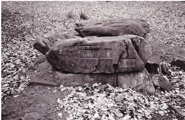
Ritterstein mit der Inschrift "Hohlog" bei Waldleiningen (Erhard Rohe, 1993)