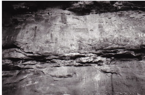
Ritterstein mit der Inschrift "Griesenfels" im Leinbachtal (Erhard Rohe, 1993)