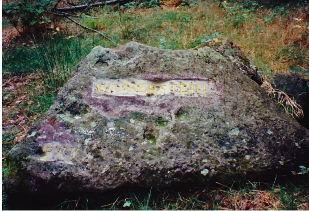
Ritterstein mit der Inschrift "Wasserstein" bei Frankenstein (Erhard Rohe, 1995)

Raphaela Maertens am 03.04.2019 um 11:44:16Uhr