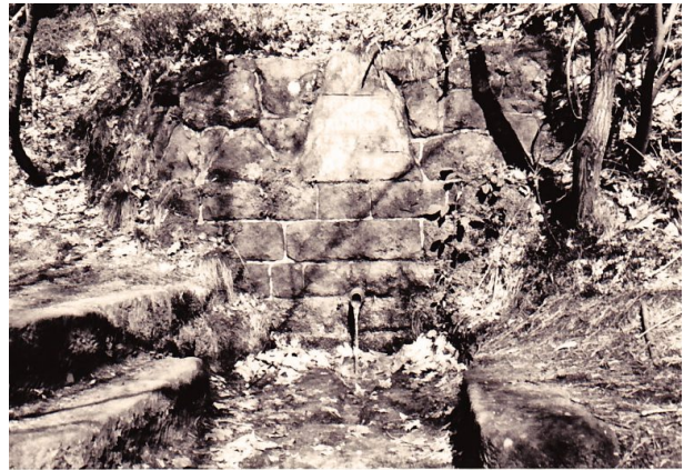
Hundsbrunnen mit dem ins Mauerwerk integrierten Ritterstein mit der Inschrift "Hundsbrunnen" im Hundbrunnertal (Erhard Rohe, 1993)