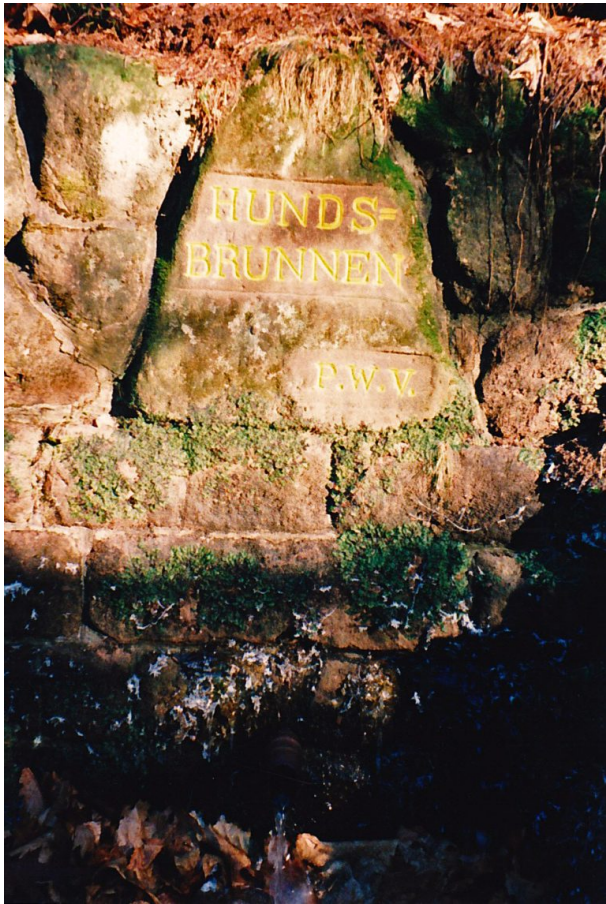
Ritterstein mit der Inschrift "Hundsbrunnen" im Hundsbrunnertal (Erhard Rohe, 2000)