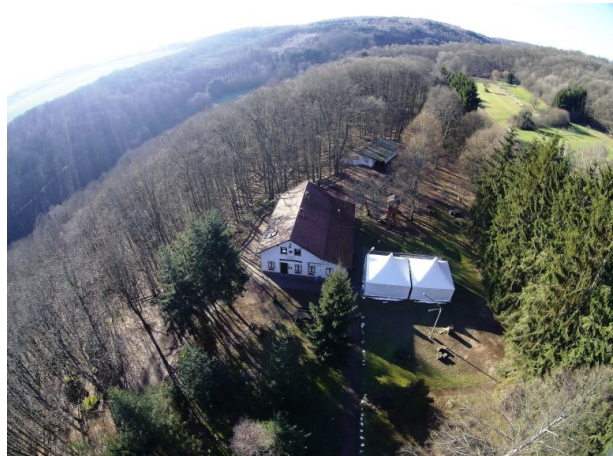
Luftansicht der Wanderhütte „Zum Hohen Fels“ bei Krottelbach