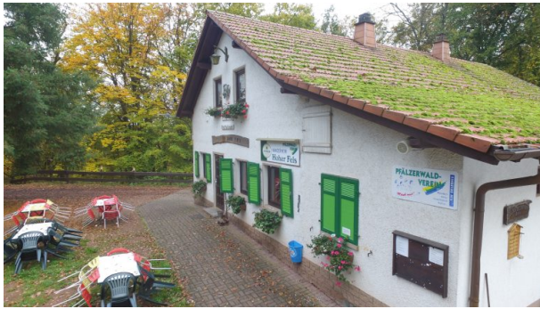
Wanderhütte „Zum Hohen Fels“ bei Krottelbach (Reiner Theiß, 2019)