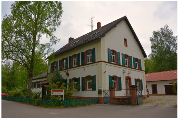
Forsthaus im Stiftswald im Jahr 2019 (Sonja Kasprick, 2019)