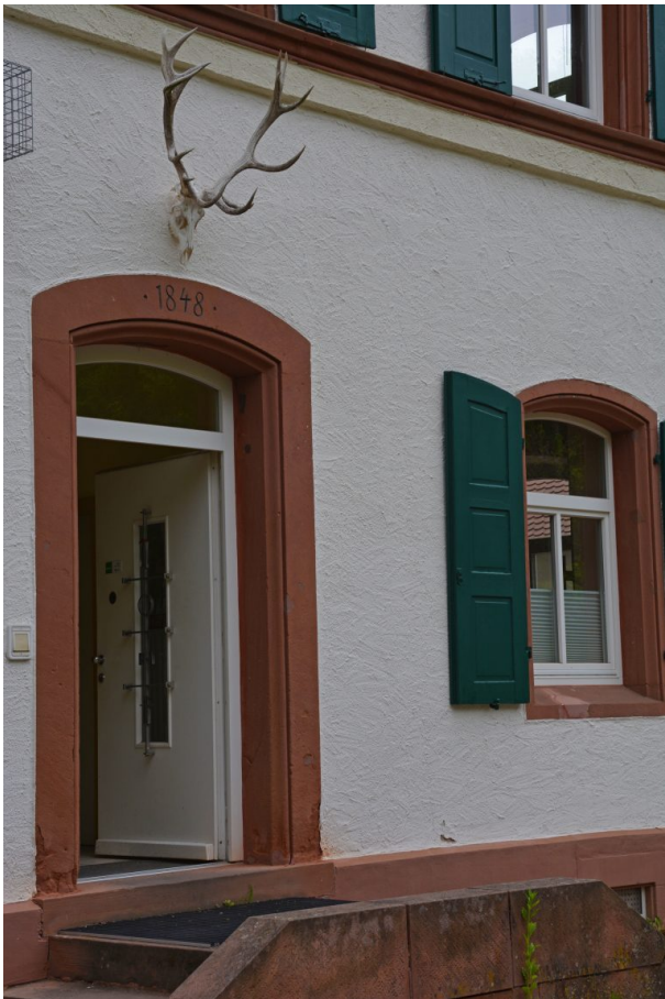
Eingangstür auf der Ostseite des Forstamtsgebäudes. In den Türsturz ist das Erbauungsjahr 1848 eingemeißelt. Darüber hängt der Schädel mit Geweih eines Hirsches