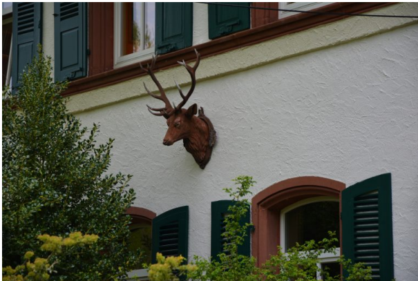
Plastische Figur eines Hirschkopfes an der Südwand des Forstamtsgebäudes im Stiftswald (Sonja Kasprick, 2019)