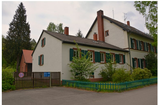
Blick von Westen auf ein Nebengebäude des Forstamts im Stiftswald. Dahinter befindet sich ein weiteres Gebäude aus Sandstein (Sonja Kasprick, 2019)