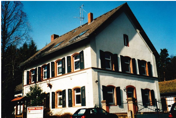
Forsthaus im Stiftswald im Jahr 2004 (Erhard Rohe, 2004)

Sonja Kasprick am 17.04.2019 um 15:36:57Uhr