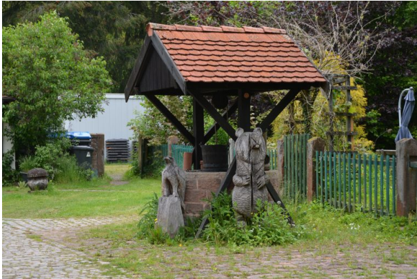
Brunnen mit einer hölzernen und mit Ziegel gedeckten Überdachung östlich des Forstamtsgebäudes. Davor stehen aus Holz geschnitzte Tierfiguren (Sonja Kasprick, 2019)