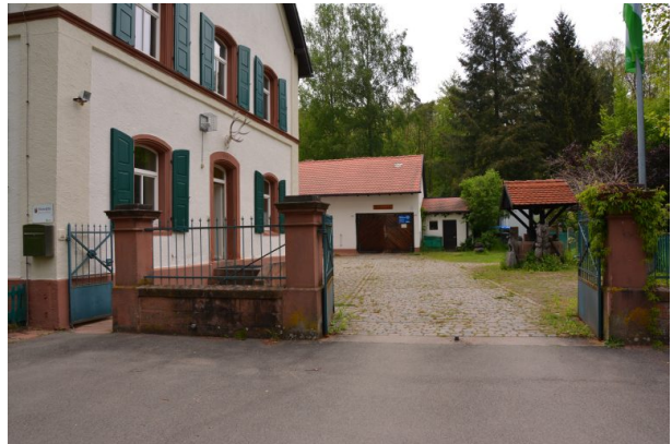
Hofeingang östlich des Forstamtsgebäudes. Im Hintergrund sind ein Brunnen sowie eine Scheune zu erkennen (Sonja Kasprick, 2019)