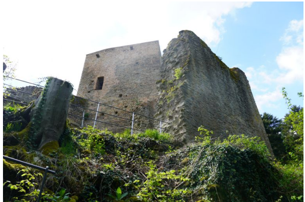
Blick auf den Bergfried der Burg Alt-Wolfstein vom Wanderweg "Wolfsweg" aus (Dana Taylor, 2021)