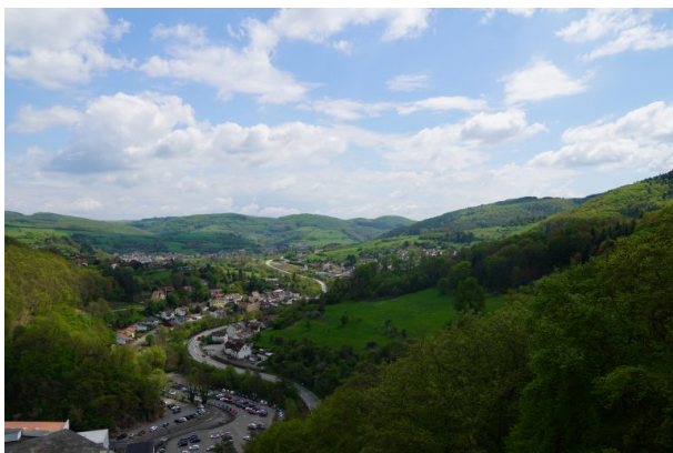
Aussicht über einen Teil des Lautertals von der Aussichtsplattform der Burg Alt-Wolfstein aus (Dana Taylor, 2021)