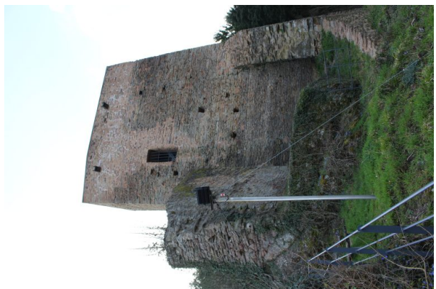
Burg Alt-Wolfstein (Peter Herzer, 2020)