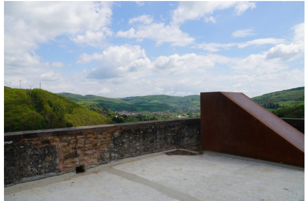
Aussichtsplattform der Ruine Alt-Wolfstein (Dana Taylor, 2021)