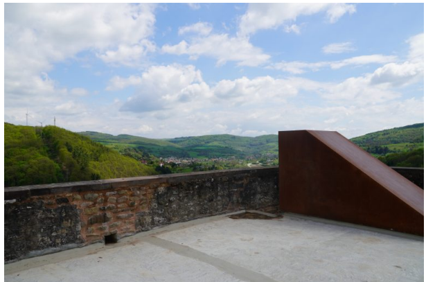
Aussichtsplattform der Ruine Alt-Wolfstein (Dana Taylor, 2021)