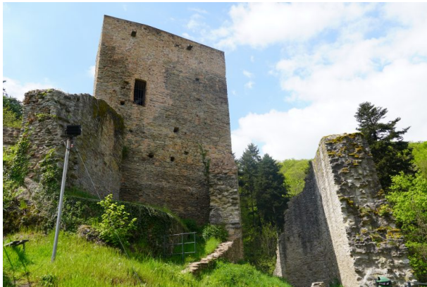
Burgruine Alt-Wolfstein (Dana Taylor, 2021)