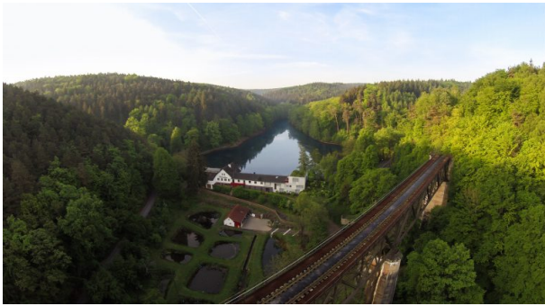
Blick in Richtung Süden vom Eistal-Viadukt über das Seehaus Forelle, Fischteiche und den Eiswoog (Anna Wojtas, 2015)