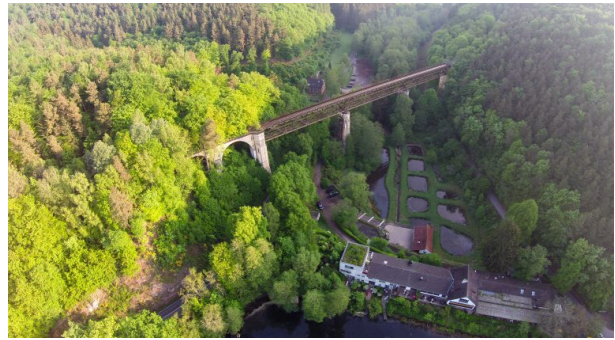
Blick vom Eiswoog in Richtung Norden. Im Vordergrund sind das Seehaus Forelle und Fischteiche zu erkennen. Dahinter erstreckt sich das Eistal-Viadukt