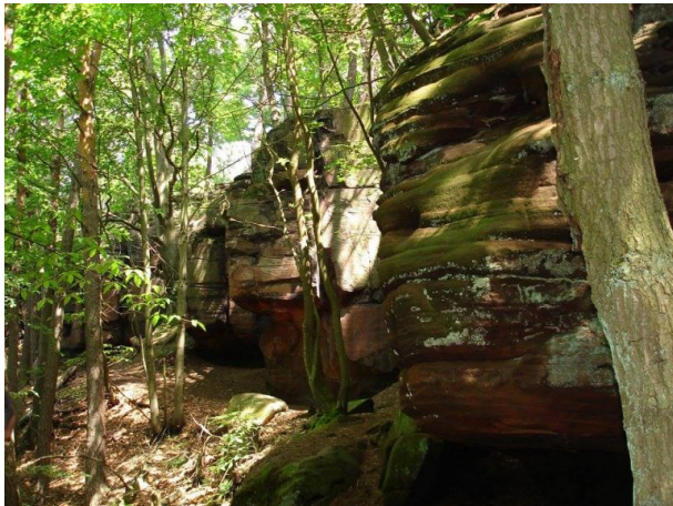
Krämerstein bei Landstuhl (Manfred Grad, 2017)