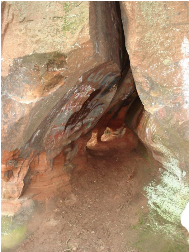
Felsenkluft des Krämersteins bei Landstuhl (Manfred Grad, 2017)