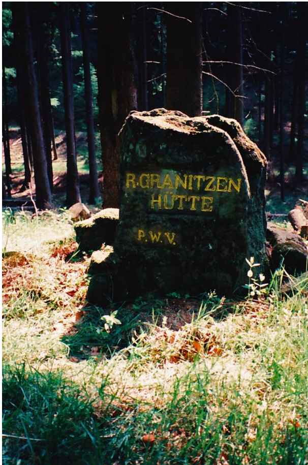
Ritterstein „R. Granitzenhütte“ (Ritterstein Nr. 40) im Horbachtal westlich der Einmündung des Mautzenbaches in den Horbach.