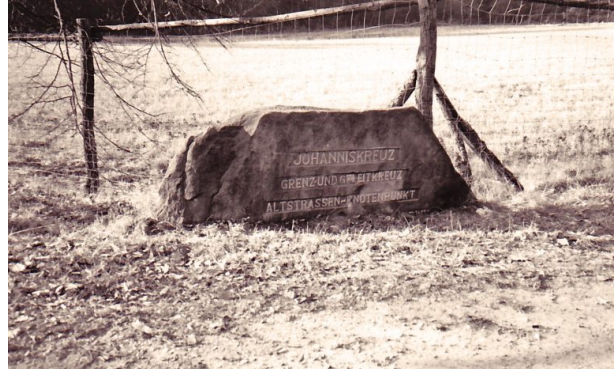
Ritterstein Nr. 111 mit der Bezeichnung "Johanniskreuz Grenz- und Geleitkreuz Altstrassen-Knotenpunkt " bei Johanniskreuz. (Erhard Rohe, 1993)