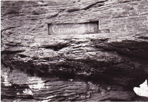
Ritterstein Nr. 100 mit der Bezeichnung "Cramerfels" als Teil eines natürlichen Felsens. (Erhard Rohe, 1993)

Sonja Kasprick am 25.06.2019 um 16:36:05Uhr