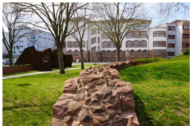
Reste der salischen Burgmauer der Kaiserpfalz (Dana Taylor, 2021)