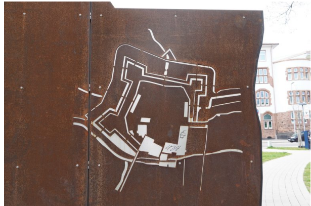
Umrissplan der ehemaligen Burganlage (Dana Taylor, 2021)