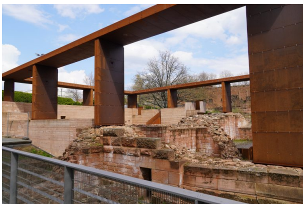
Reste der Kaiserpfalz von Friedrich I. "Barbarossa" (Dana Taylor, 2021)