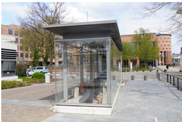
Ausgang aus dem unterirdischen Gang des Casimirschlosses (Dana Taylor, 2021)