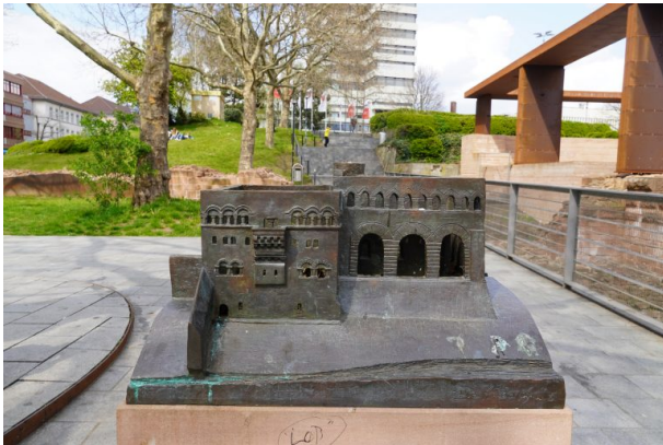
Model der Kaiserpfalz vor den Überresten der Burg (Dana Taylor, 2021)