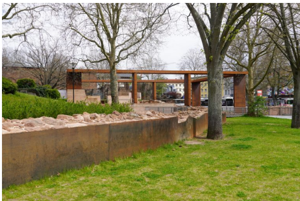
Reste der Kaiserpfalz von Friedrich I. "Barbarossa" (Dana Taylor, 2021)

Raphaela Maertens am 26.06.2019 um 14:00:34Uhr