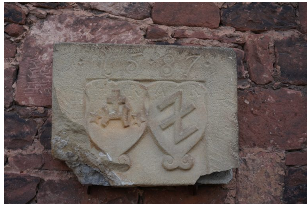
Inschrift mit Jahreszahl am Casimirschloss (Dana Taylor, 2021)