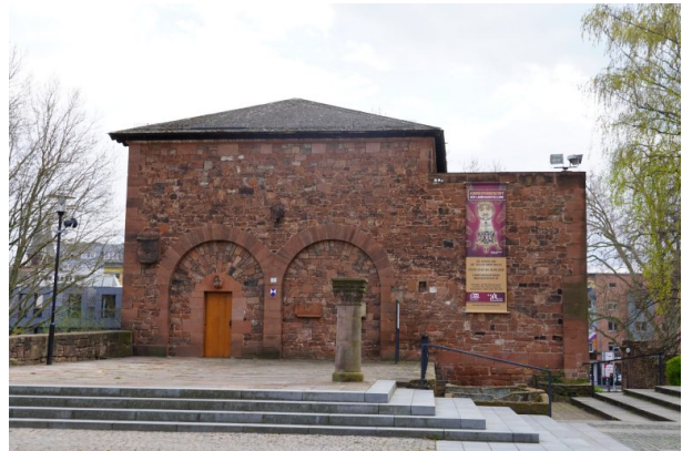
Renaissanceschloss des Pfalzgrafen Johann Casimir (Dana Taylor, 2021)