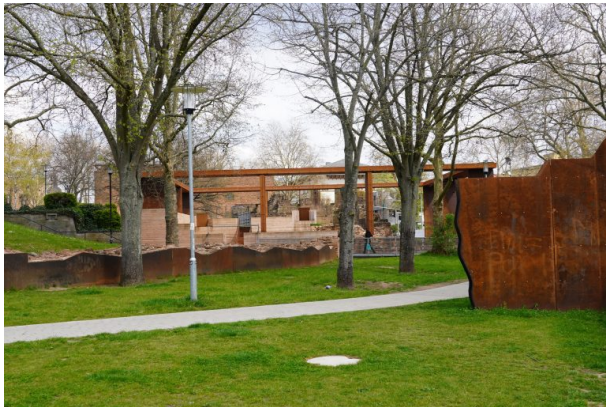
Blick auf die Reste der Reste der Kaiserpfalz von Friedrich I. "Barbarossa" (Dana Taylor, 2021)