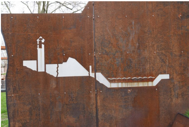
Ansichtsskizze der ehemaligen Burganlage (Dana Taylor, 2021)