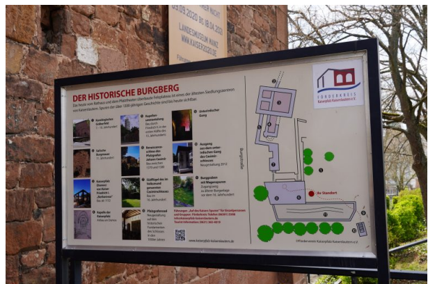
Informationstafel vor dem Casimirschloss (Dana Taylor, 2021)