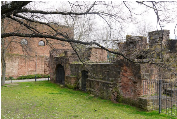
Reste des Südflügels des Casimirschlosses (Dana Taylor, 2021)