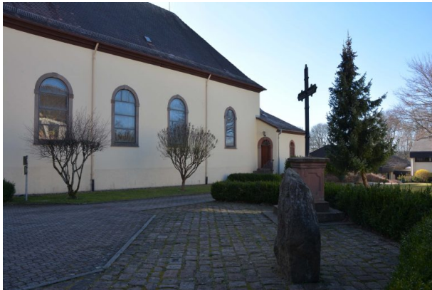
Langhaus der katholischen Kirche in Trippstadt. (Sonja Kasprick, 2018)