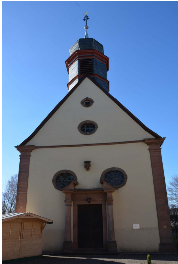
Südseite der katholischen Kirche in Trippstadt.