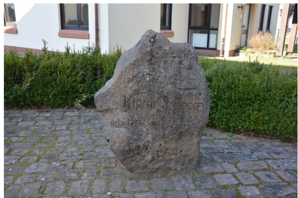
Inschrift: Kath. Kirche St. Josef, erb. 1754 (Sonja Kasprick, 2018)