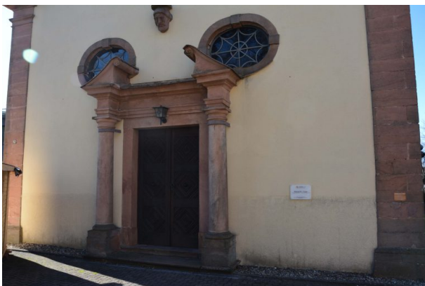
Eingangsportal der katholischen Kirche in Trippstadt.