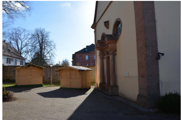
Im Winter findet vor der katholischen Kirche in Trippstadt ein Weihnachtsmarkt statt.