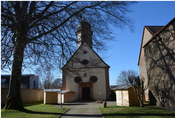
Zuweg zur katholischen Kirche in Trippstadt. (Sonja Kasprick, 2018)