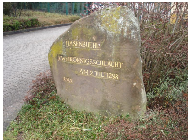
Ritterstein Nummer 295 in Göllheim mit der Inschrift „Hasenbuehl – Zweikoenigsschlacht – am 02. Juli 1298“ und "PWV". (Manfred Grad, 2018)