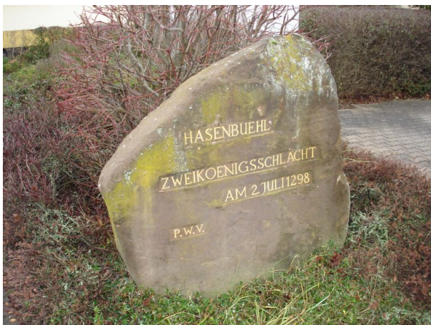
Ritterstein Nummer 295 in Göllheim mit der Inschrift „Hasenbuehl – Zweikoenigsschlacht – am 02. Juli 1298“ und "PWV". (Manfred Grad, 2018)