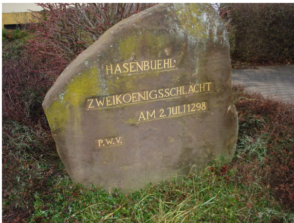
Ritterstein Nummer 295 in Göllheim mit der Inschrift „Hasenbuehl – Zweikoenigsschlacht – am 02. Juli 1298“ und "PWV".

Manfred Grad am 27.06.2019 um 16:33:06Uhr