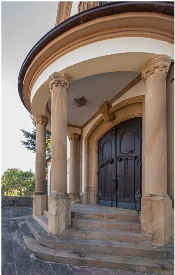
Eingangportal der katholischen Kirche (Harald Kröher, 2018)