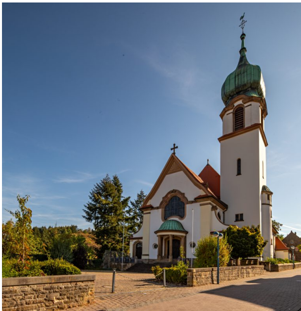
Blick auf die Westseite und den Kirchturm (Harald Kröher, 2018)

Raphaela Maertens am 09.07.2019 um 14:11:08Uhr