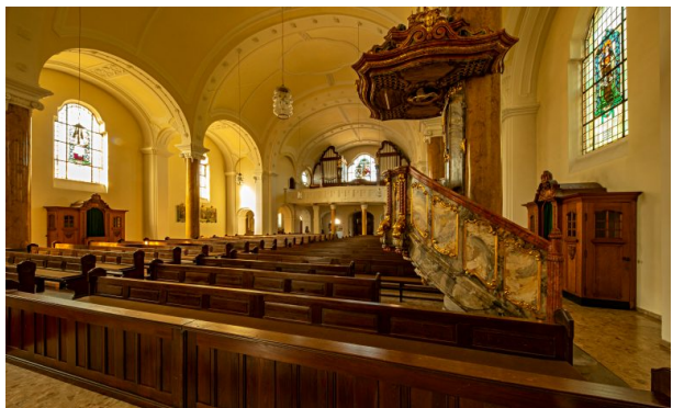
Blick in das dreijochige Langhaus. Im Vordergrund ist die reichverzierte Kanzel zu sehen (Harald Kröher, 2018)