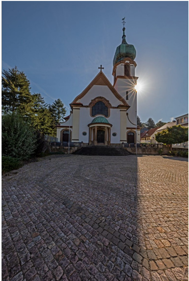
Blick auf die dreischiffige katholische Kirche (Harald Kröher, 2018)