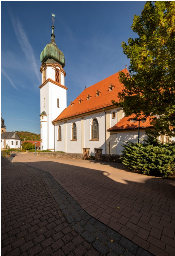
Blick auf das Langhaus und den Kirchturm der katholischen Kirche. Im Hintergrund ist die protestantische Kirche zu sehen (Harald Kröher, 2018)