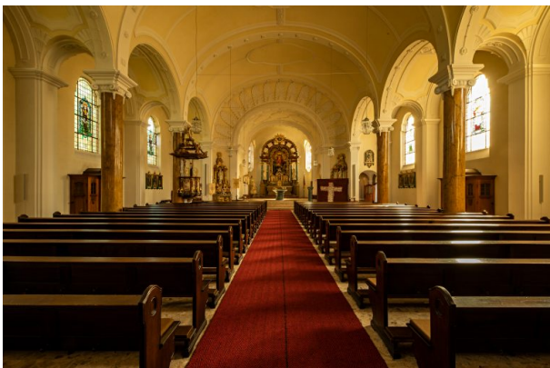
Blick in das Langhaus und den Chor mit dem reichverzierten Hochaltar