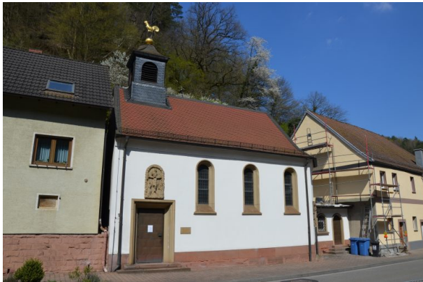
Südseite der katholischen Kirche in Frankenstein - Sicht von der Hauptstraße (Dr. Hans-Günther Clev, 2020)