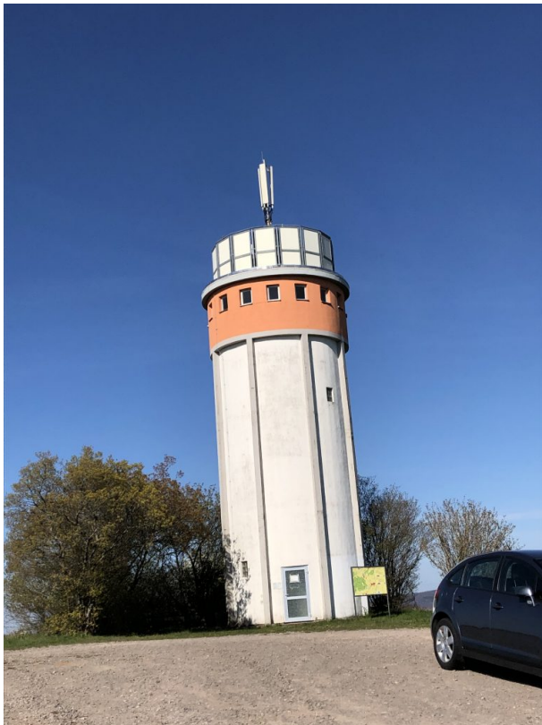
Wasserturm am Sangerhof (Dana Taylor, 2021)

Sonja Kasprick am 17.07.2019 um 15:10:38Uhr