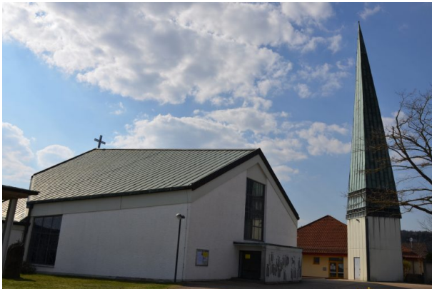
Blick auf die Ostseite der katholischen Kirche in Krickenbach

Raphaela Maertens am 24.07.2019 um 10:17:24Uhr