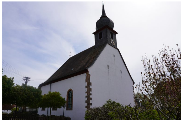
Protestantische Kirche in Misau (Dana Taylor, 2020)