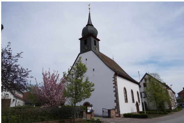
Protestantische Kirche in Misau (Dana Taylor , 2020)

Raphaela Maertens am 16.08.2019 um 16:14:33Uhr