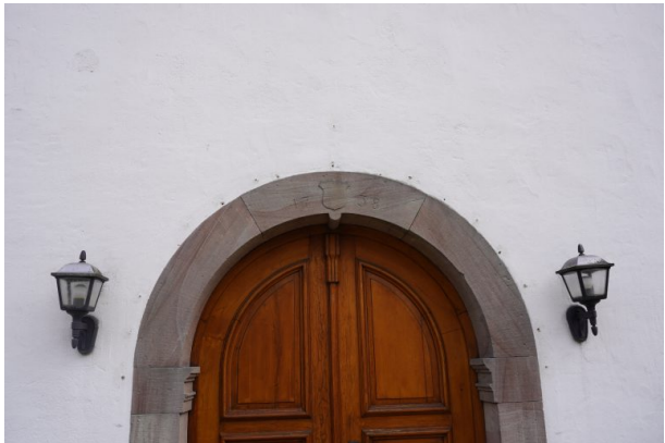
Eingangstür der protestantischen Kirche in Misau (Dana Taylor, 2020)