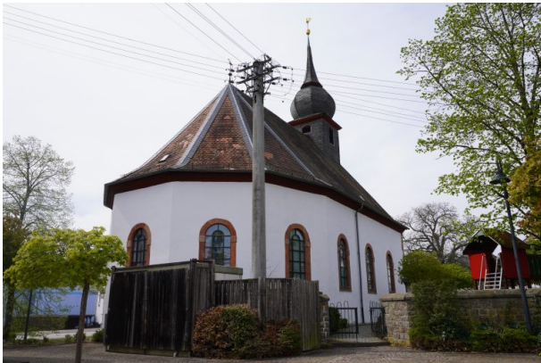
Blick auf den Chor der protestantischen Kirche in Misau (Dana Taylor, 2020)