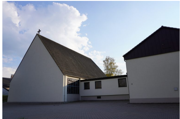
Blick von der Kottweiler Straße auf die katholische Kirche in Steinwenden (Dana Taylor, 2020)