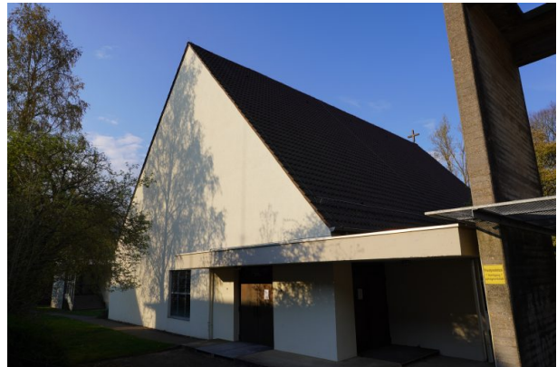
Blick auf die katholische Kirche in Steinwenden von der Freiherr-von-Ketteler-Straße (Dana Taylor, 2020)