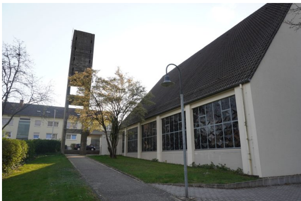
Katholische Kirche in Steinwenden (Dana Taylor, 2020)

Raphaela Maertens am 21.08.2019 um 10:03:46Uhr