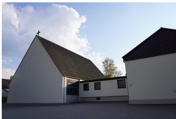
Blick von der Kottweiler Straße auf die katholische Kirche in Steinwenden (Dana Taylor, 2020)