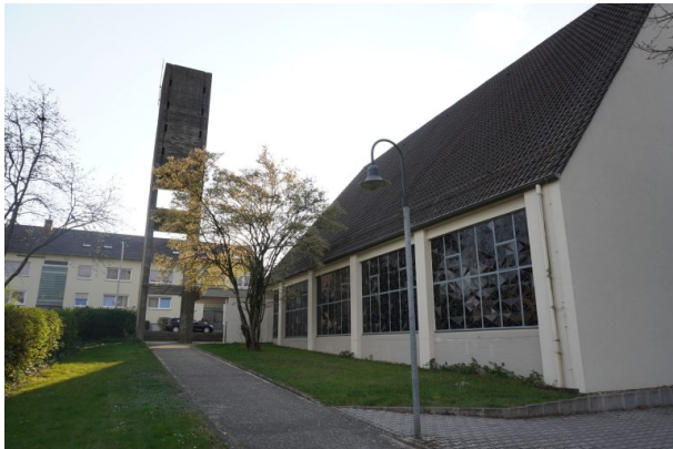
Katholische Kirche in Steinwenden (Dana Taylor, 2020)

Raphaela Maertens am 21.08.2019 um 10:03:46Uhr