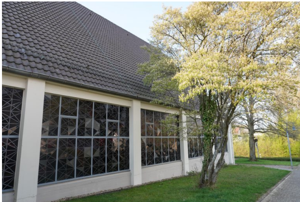
Fensterfront der katholischen Kirche in Steinwenden (Dana Taylor, 2020)