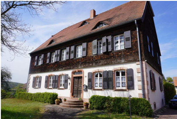
Protestantisches Pfarrhaus in Steinwenden (Dana Taylor, 2020)