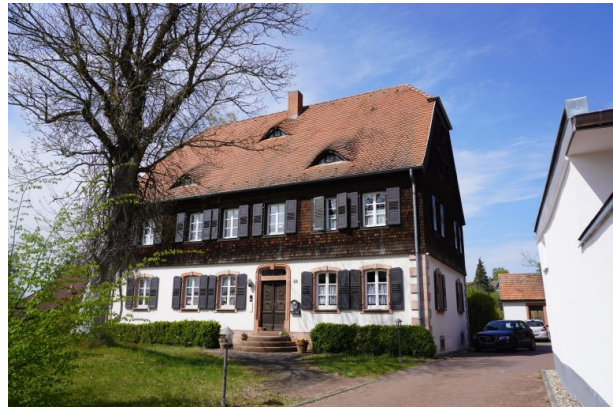
Protestantisches Pfarrhaus in Steinwenden (Dana Taylor, 2020)