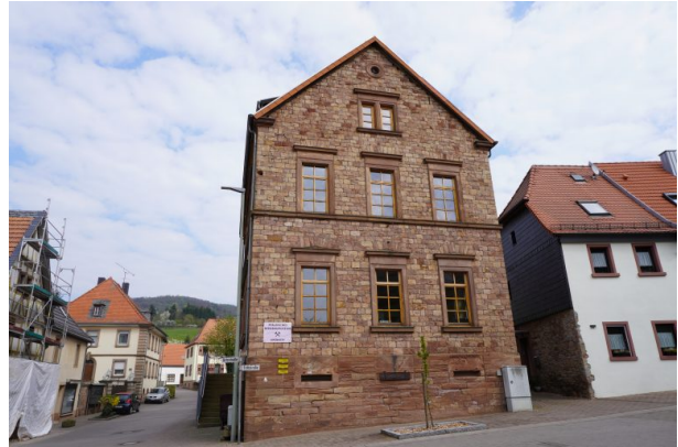
Pfälzisches Bergbaumuseum in Imsbach (Dana Taylor , 2020)