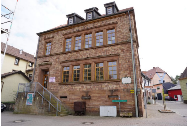
Pfälzisches Bergbaumuseum in Imsbach (Dana Taylor , 2020)