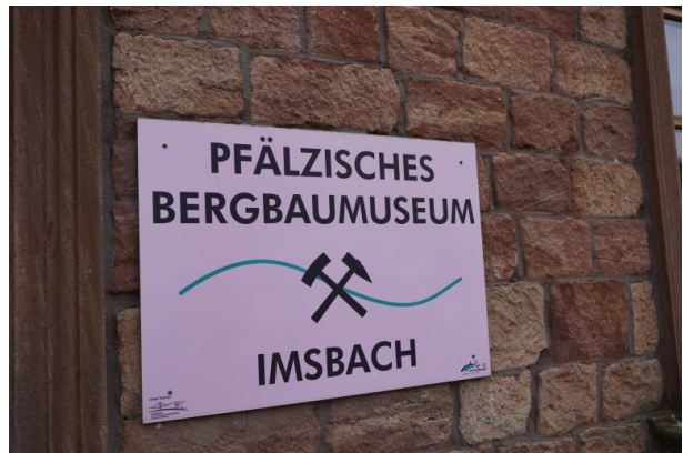
Pfälzisches Bergbaumuseum in Imsbach (Dana Taylor , 2020)