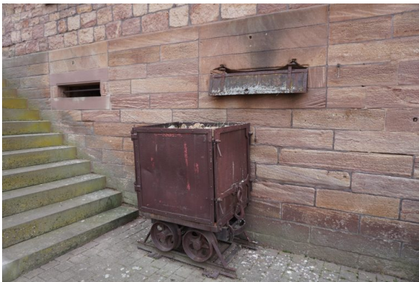
Alter Bergbauförderwagen vor dem Museum (Dana Taylor , 2020)