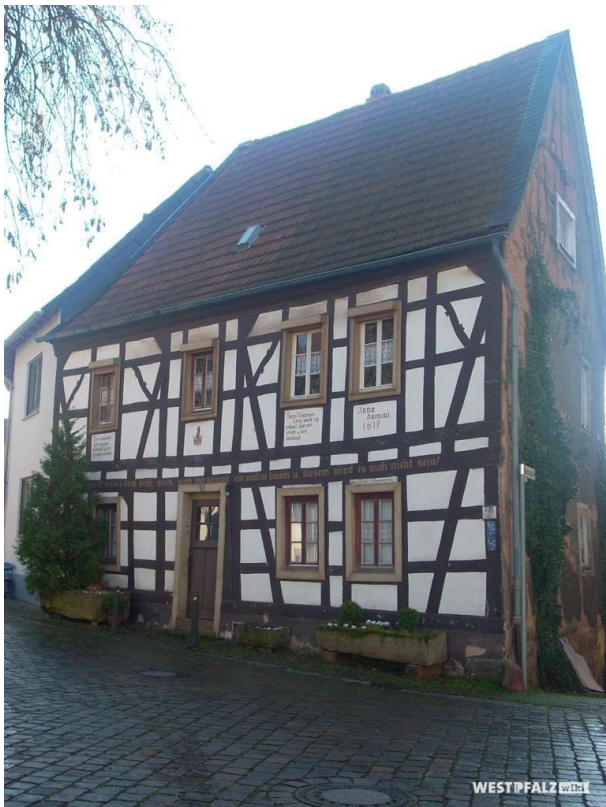
Fachwerkhaus Galecki in Otterberg (VG Otterbach-Otterberg, 2019)

Sonja Kasprick am 27.09.2019 um 10:47:17Uhr