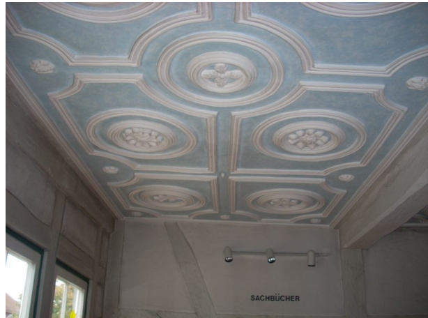
Stuckdecke in der alten Apotheke in Otterberg (VG Otterbach-Otterberg, 2019)