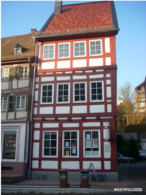
Außenansicht der alten Apotheke in Otterberg (VG Otterbach-Otterberg, 2019)