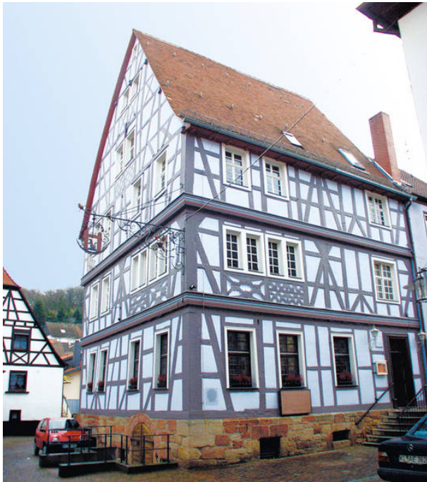
Blaues Haus in Otterberg (VG Otterbach-Otterberg, 2019)