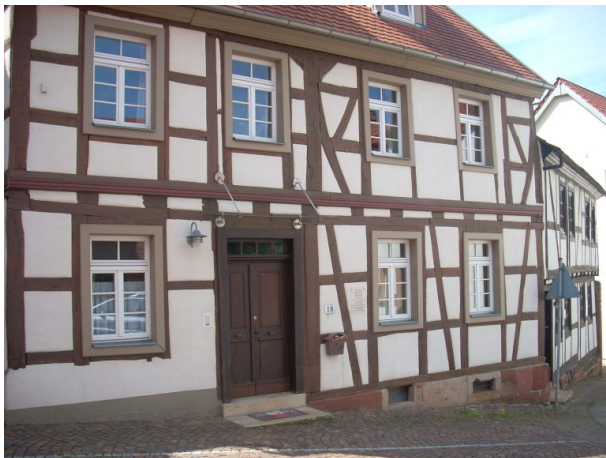
Ehemalige Engelsche Mühle in Otterberg (VG Otterberg-Otterbach, 2019)

Dana Taylor am 10.10.2019 um 09:17:57Uhr