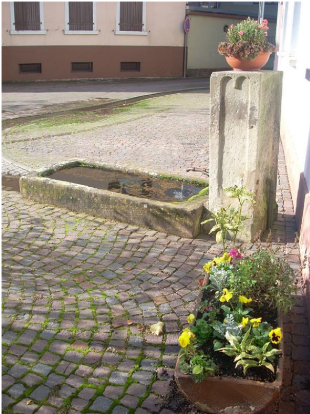
Erbsenbrunnen in Otterberg (VG Otterbach-Otterberg, 2019)

Dana Taylor am 15.10.2019 um 09:01:26Uhr