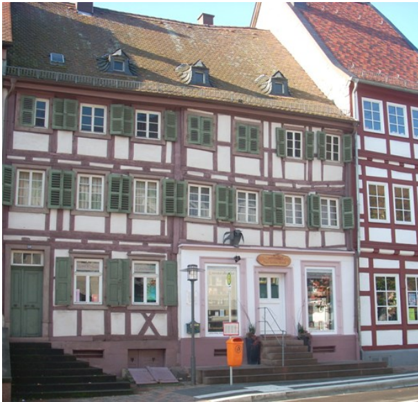
Ferkelsches Haus in Otterberg. Am rechten Bildrand ist die Alte Apotheke zu sehen.