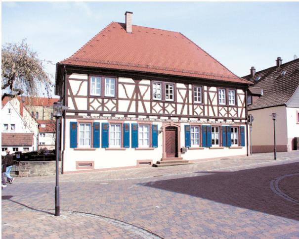
Französisch-reformiertes Pfarr- und Schulhaus in Otterberg (VG Otterbach-Otterberg, 2019)

Dana Taylor am 09.10.2019 um 11:59:20Uhr