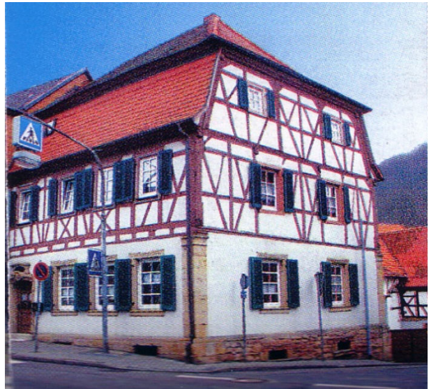
Haus Jörg in Otterberg (VG Otterbach-Otterberg, 2019)