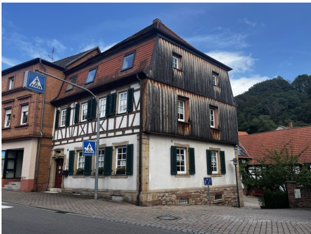
(Philipp Markgraf, 2024)

Dana Taylor am 10.10.2019 um 09:37:53Uhr