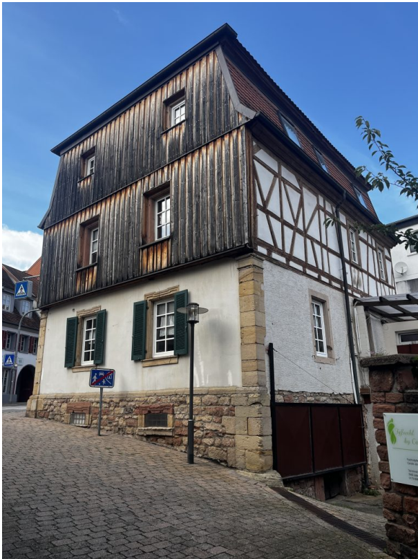
(Philipp Markgraf, 2024)