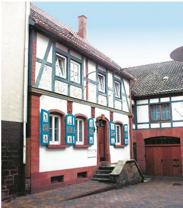
Haus Karch in Otterberg (VG Otterbach-Otterberg, 2019)

Dana Taylor am 10.10.2019 um 10:15:04Uhr