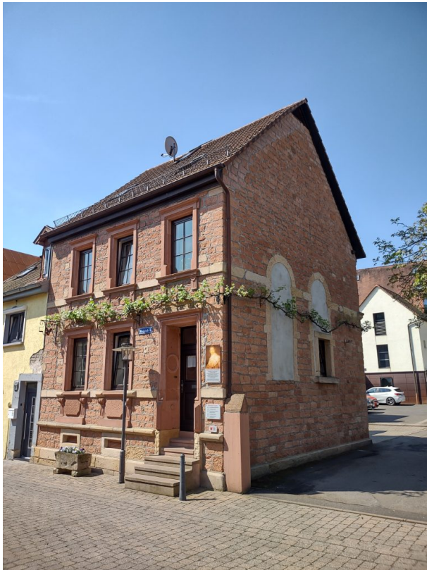
Ehemalige Synagoge mit Infotafeln (Arne Schwöbel, 2023)